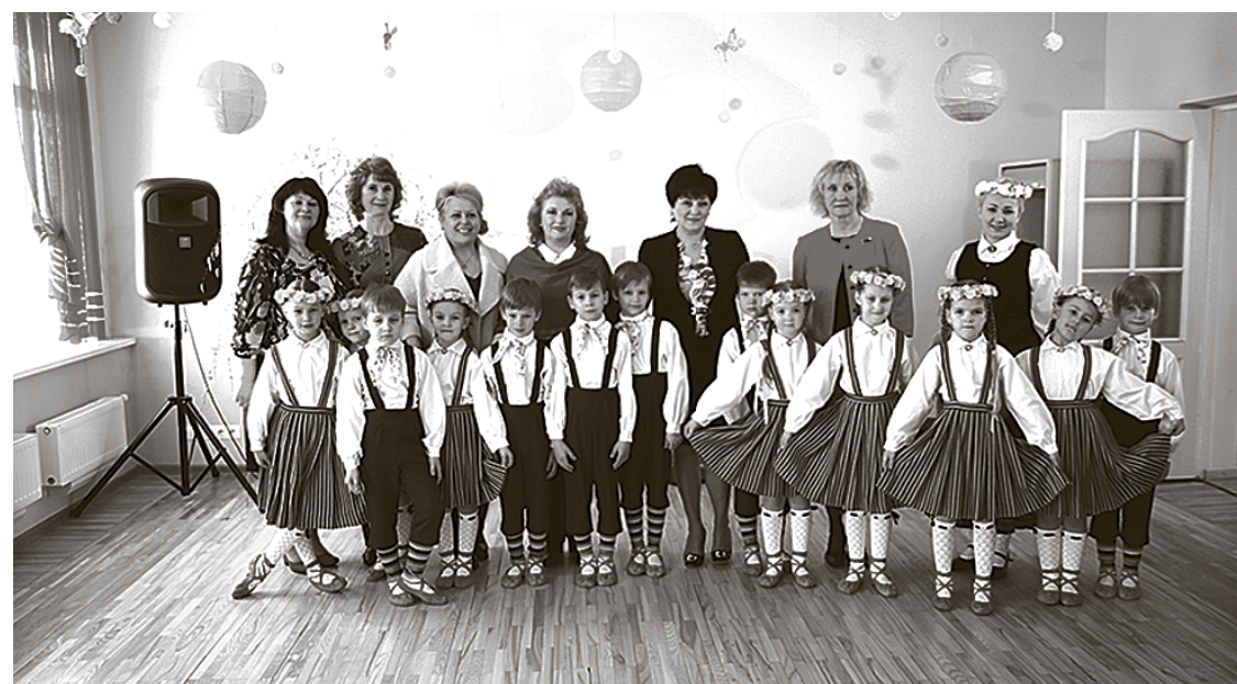
Moldovas delegācija bērnudārzā Baložos.