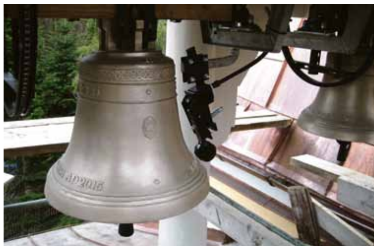
Jaunie zvani baznīcas zvanu tornī.