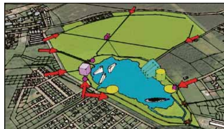
Tīturgas ezera aktīvās atpūtas parka variants.

Izvērtējot publiskās apspriešanas rezultātus un respondentu ieteikumus publiskās apspriešanas laikā, Ķekavas novada dome nolēma, veicot Tīturgas ezera aktīvās atpūtas parka projekta izstrādi, projektu papildināt ar labiekārtojuma elementiem no Tīturgas ezera tematiskā parka, veidota no dabas elementiem, un Tīturgas ezera dabas parka. Pirms