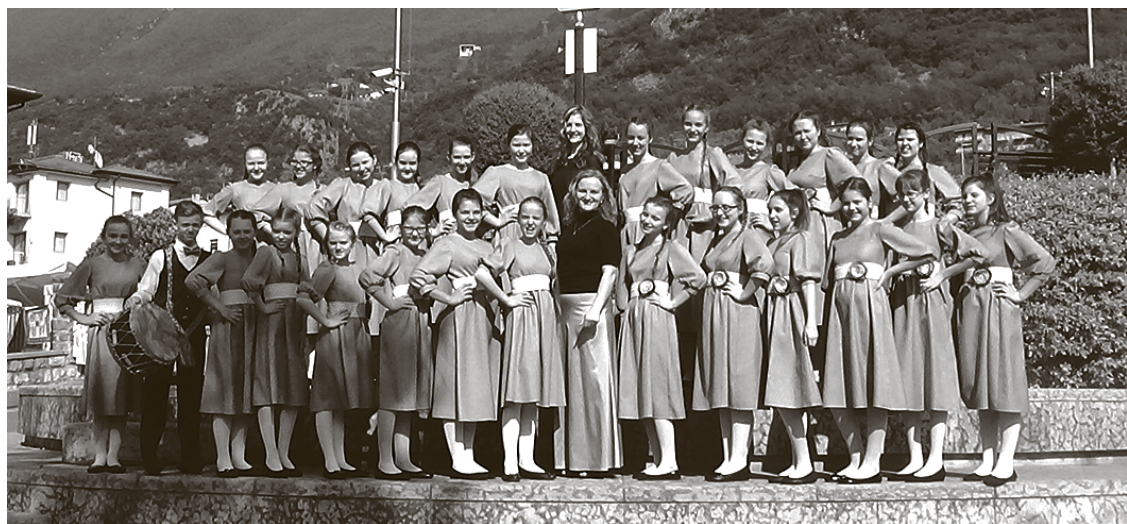
Ķekavas Mūzikas skolas koris un pedagogi.