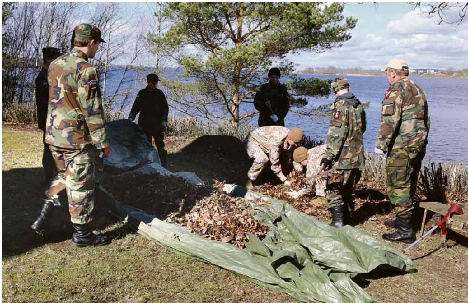
Nacionālie bruņotie spēki talko Nāves salā.

Lielās talkas dienā laiks lutināja ar saules stariem, lai ar lielāku prieku mudinātu cilvēkus ķerties klāt pavasara sakopšanas darbiem. Šogad Ķekavas novadā tika reģistrētas 45 oficiālas talkošanas vietas: trīsdesmit divas – Ķekavas pagastā, vienpadsmit – Baložu pilsētā, trīs – Daugmales pagastā.