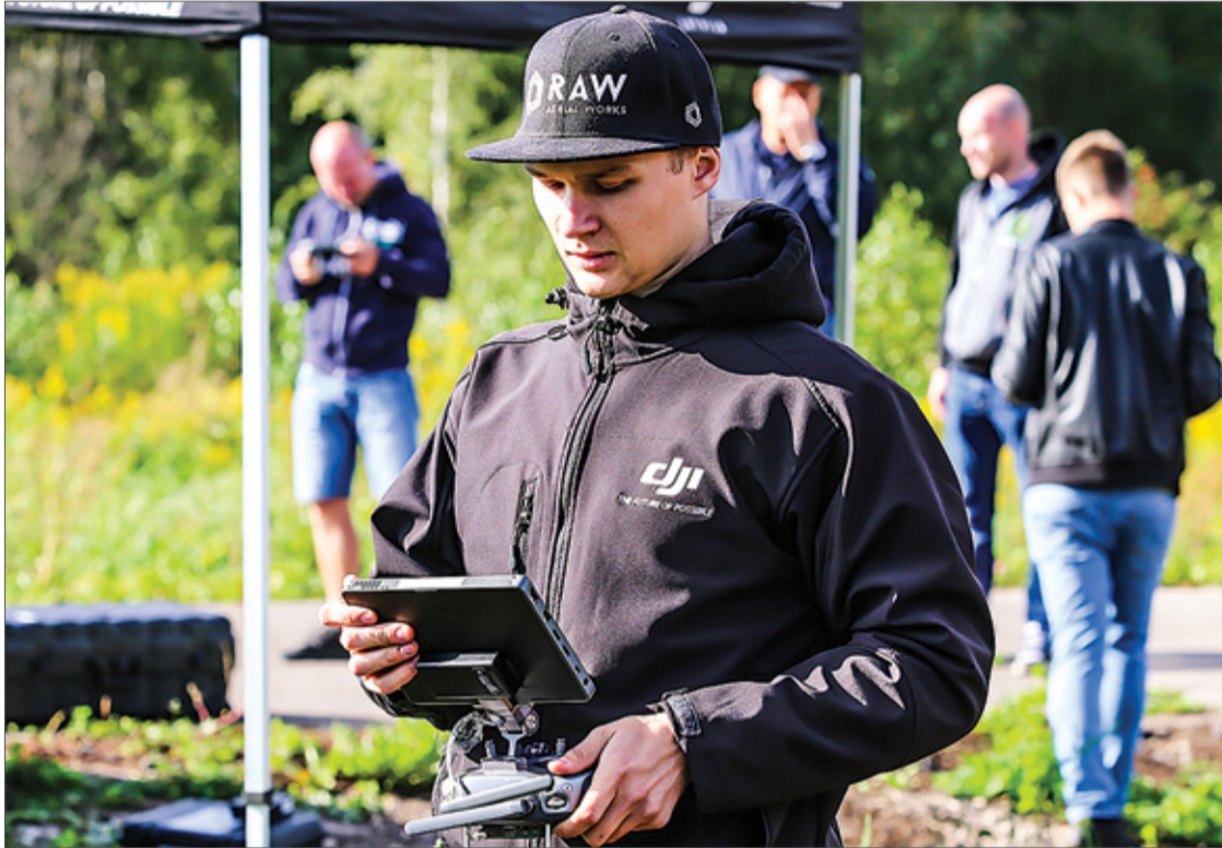
„SPH Engineering” un „DJI Latvija” pārstāvji pārstāvis vada apmācību Baložos.