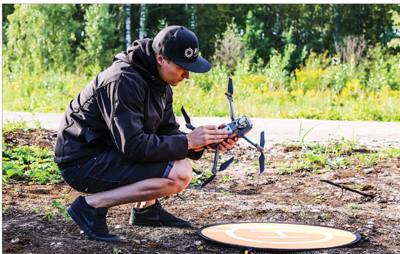
Inovatīvo tehnoloģiju uzņēmuma „DJI Latvija” pārstāvis vada apmācību Baložos.