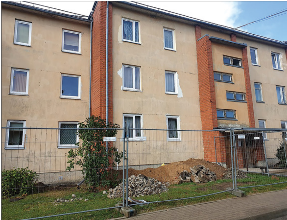
Daudzdzīvokļu dzīvojamā māja Ķekavā, Nākotnes ielā 8.

Septembrī uzsākti būvdarbi, lai paaugstinātu energoefektivitāti vēl vienai daudzdzīvokļu mājai Ķekavā – ēkai Nākotnes ielā 8.