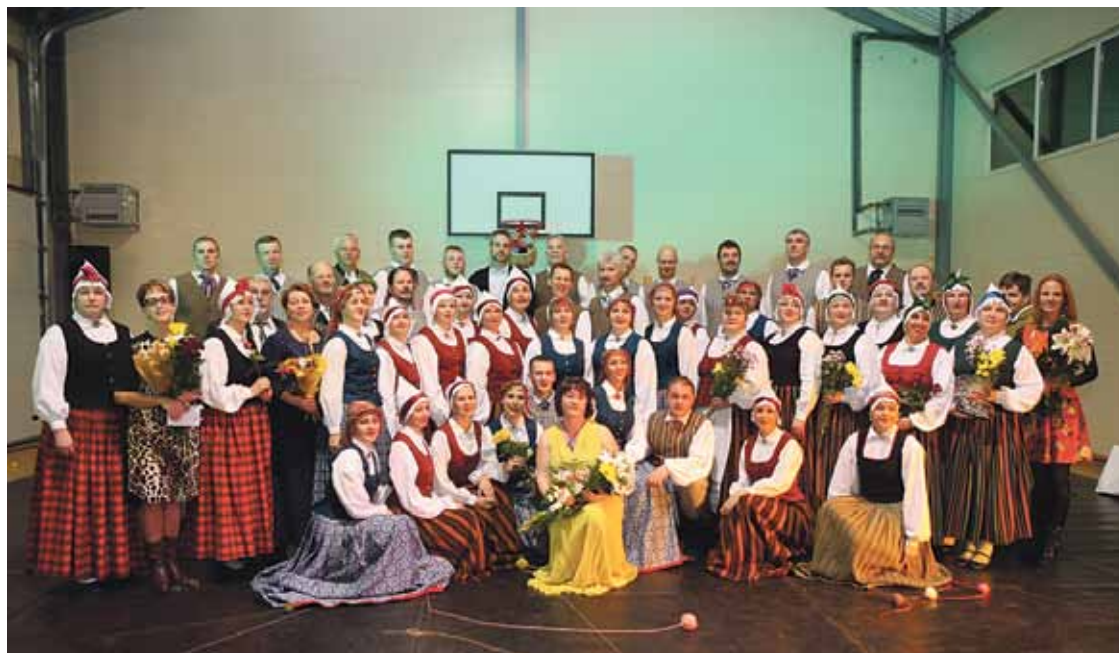
Deju kolektīvs „Savieši”.