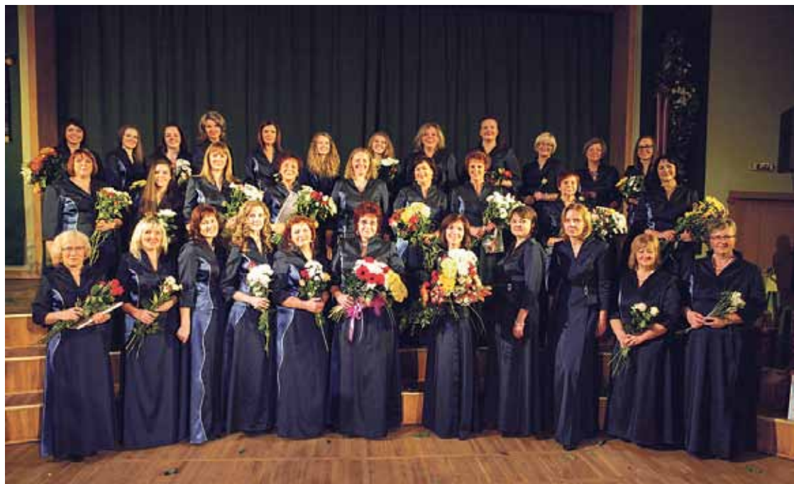
Sieviešu koris „Daugaviete”.