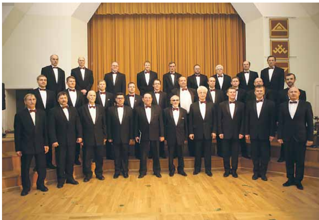
Vīru koris „Ķekava”.